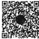
หนังสือนัดประชุม และระเบียบวาระการประชุม ร่วมกันของรัฐสภา

๒. รายงานการประชุมร่วมกันของรัฐสภา (สมัยสามัญประจำปีครั้งที่สอง) ครั้งที่ ๖ - ๗ ได้วางให้สมาชิกตรวจสอบเมื่อวันศุกร์ที่ ๒๐ มกราคม ๒๕๖๖ และครั้งที่ ๘ - ๙ ได้วางให้สมาชิก ตรวจสอบเมื่อวันจันทร์ที่ ๓๐ มกราคม ๒๕๖๖ บริเวณหน้าห้องประชุมสภาผู้แทนราษฎร ชั้น ๒ สำนักงานเลขาธิการสภาผู้แทนราษฎร และห้องรับรองสมาชิกวุฒิสภา ชั้น ๒ สำนักงานเลขาธิการวุฒิสภา ก่อนเสนอให้ที่ประชุมร่วมกันของรัฐสภารับรอง รวมถึงจัดให้มีข้อมูลในรูปแบบหนังสืออิเล็กทรอนิกส์ เพื่อให้สมาชิก ตรวจสอบดูรายงานการประชุมได้ตามที่ร้องขอตามข้อบังคับฯ ข้อ ๒๓ วรรคหนึ่ง